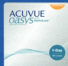
ACUVUE MD OASYS 1-jour