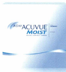
ACUVUE MD MOIST 1-JOUR