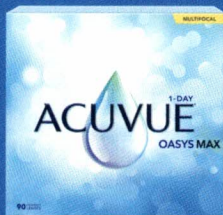
ACUVUE MD OASYS MAX 1-jour